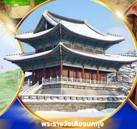
พระราชวังเคียงบกคยอง