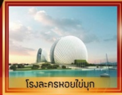
โรงละครхойไข่มุก