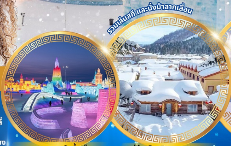
เทศกาลแกะสลักน้ำแข็ง

จตุรัสโบสถ์เซินโซเฟีย ถนนจงยาง หมู่บ้านหิมะดินแดนมหัศจรรย์ อนุสาวรีย์ฝั่งหง สนุกสนานกับลานสกียาปูลี่ ถนนแสนยุนเจีย เขาแกะหลัว เขาปังจุย ภาพเขียน Ice and Snow แม่น้ำซงฮัวเจียง โซวว้ายน้ำแข็ง เกาะพระอาทิตย์