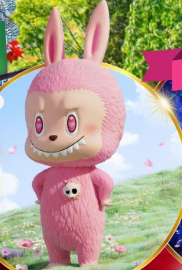
Pop Mart สงแด