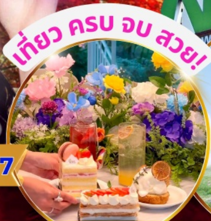
คาเฟ่ดัง Forest Outing