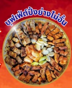
บุฟเฟ่ต์ปิ้งย่างไม่เว้น