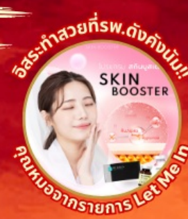
อิสระทำสวยที่พ.ดังคังนัม!! SKIN BOOSTER คุณหมอจากรายการ Let Me In

ที่เที่ยงใหม่ล่าสุด รีสอร์ท 5ดาว ใหญ่ที่สุดในเอเชียเหนือ แวะคาเฟ่ดัง เปลี่ยนริมสวยตามเทศกาล เข้าชมถ้ำอดีตเหมืองทอง คล้องใจที่กุญแจ โซล ทาวเวอร์