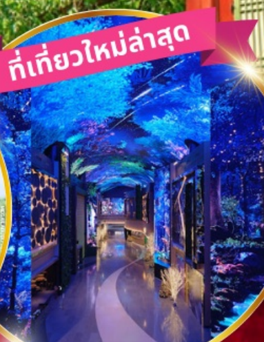
INSPIRE Entertainment Resort