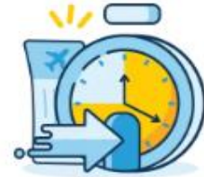
Check-in Time Limit