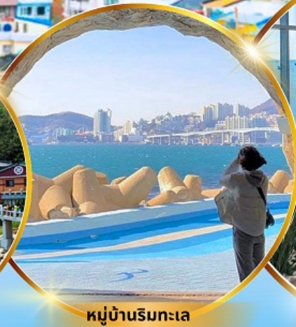
หมู่บ้านริมทะเล