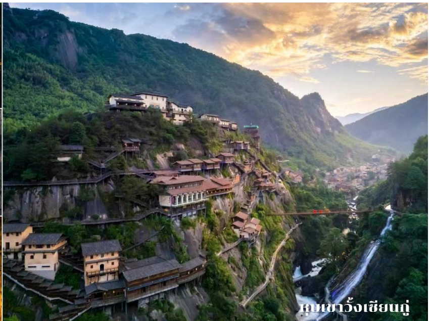
ทิวเขาฉางเซียงหนู่

ที่พัก 📍 Shangrao jialaite Hotel 4* หรือเทียบเท่า