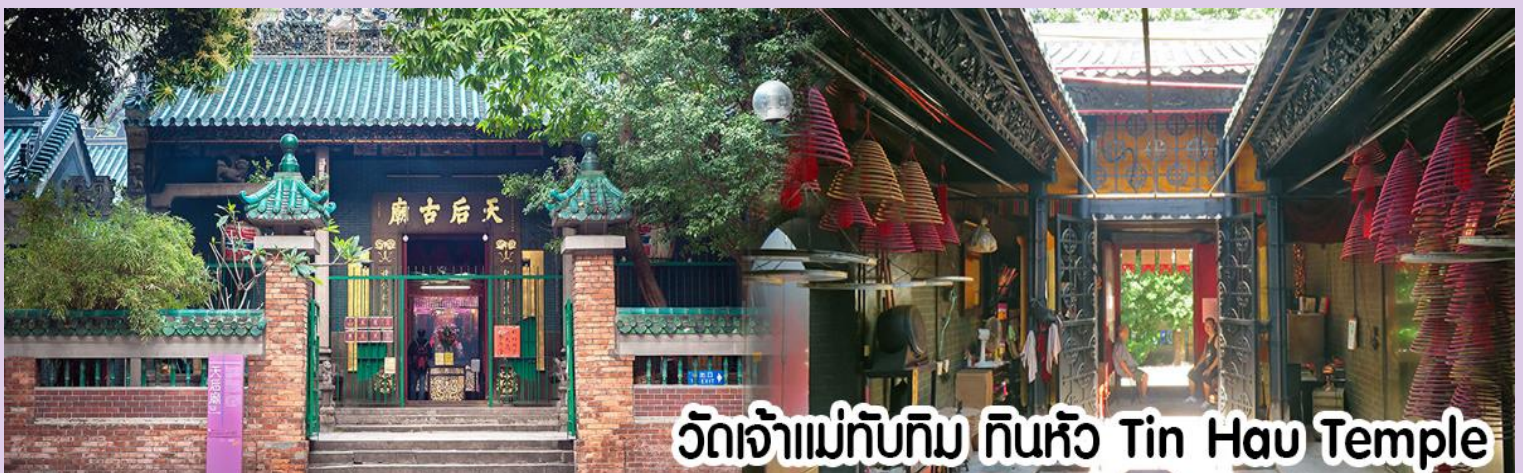
วัดเจ้าแม่ทับทิม ทินหัว Tin Hau Temple

นำทุกท่าน ไหว้ศาลเจ้าแม่ทับทิม ทินหัว (Tin Hau Temple) เป็นวัดเก่าแก่และสำคัญอีกวัดหนึ่งของฮ่องกง เพราะในสมัยก่อน ฮ่องกงเป็นเพียงหมู่บ้านชาวประมง ซึ่งเคารพนักก็คือเจ้าแม่ทับทิมว่าเป็นเทพีแห่งท้องทะเล เพื่อให้เดินทางปลอดภัย เวลาออกไปทำงานไกลๆ หรือออกหาปลา นอกจากการมาสักการะบูชาเจ้าแม่ทับทิมในเรื่องของการเดินทางให้ปลอดภัยแล้ว ไฮไลท์สำคัญอีกอย่างหนึ่งของวัดเจ้าแม่ทับทิม ทินหัว (Tin Hau Temple) จะเป็นขดรูปสี่แดงขนาดใหญ่ ที่แขวนอยู่ตามเพดานด้านบนของวัดก็จะเป็นสถาปัตยกรรมแบบวัดจีน สร้างขึ้นตั้งแต่ปี ค.ศ. 1876 โดยทางเข้าของวัดจะอยู่ติดกับสวนสาธารณะเล็ก ๆ ที่มีต้นไม้ใหญ่หลายต้น ให้บรรยากาศร่มรื่น