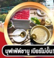
บุฟเฟ่ต์ชาบู เนิอร์ไม้อื่น!!