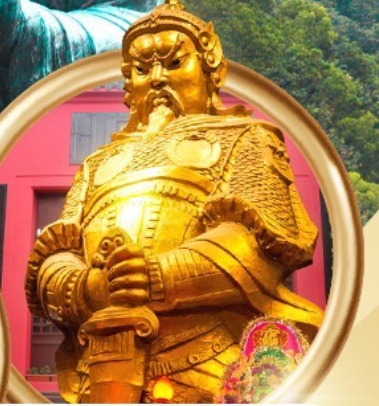
วัดเขangkหมิว