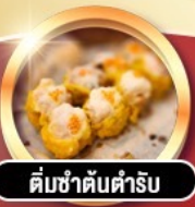
ติ่มซำต้นตำรับ

การ์ตูนดี!! พักหรู 4 ดาว PRUDENTIAL HOTEL ติดถนนนาธาน ย่านช้อปปิ้งจิมซาจอย