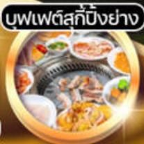
บุฟเฟ่ต์สุกี้ปิ้งย่าง