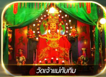
วัดเจ้าแม่กัมมทิน