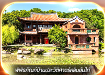
พิพิธภัณฑ์บ้านประวัติศาสตร์หลินอันไท่