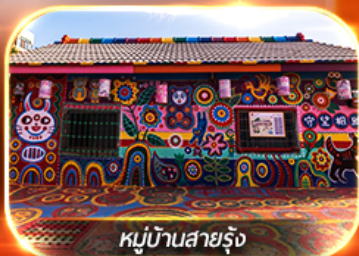
หมู่บ้านสายรุ้ง