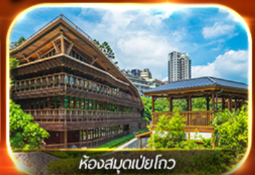
ห้องสมุดเป่ย์โกว

อาลีซาน นั่งรถไฟสายโรแมนติก ช้อปปิ้งจู่โจว ตลาดซีเหมินติง , กลอเลีย เอ๋ากั๊ต ล่องเรือชมทะเลสาบสุริยันจันทรา สะพานคู่รัก ห้องสมุดเป่ย์โกว ถนนโบราณตีนส่วย