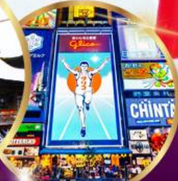
ช้อปปิ้ง ซินโซบาชิ

ราคา เดียว 49,919 บาท รวมภาษีมูลค่าเพิ่ม 7%