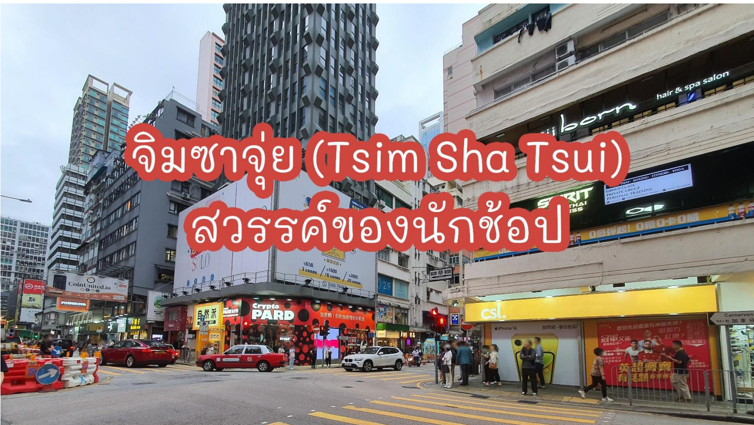
ย่านจิมซาจุ่ย ถนนนาธาน

เป็นแหล่งรวบรวมสินค้าแบรนด์เนมจากทั่วทุกมุมโลก โดยเฉพาะเลือกซื้อสินค้าประเภทต่าง ๆ อย่างเต็มอิมใจ จนกว่าถึงเวลานัด