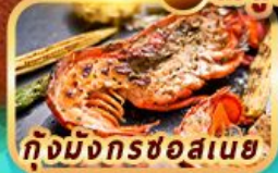
กุ้งมังกรชอสนาย