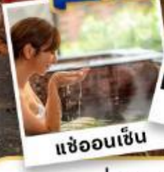
แซ่ออนเซ็น