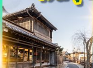
เมืองเก่าซาวาระ