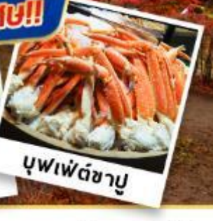
บุฟเฟต์ชาบู