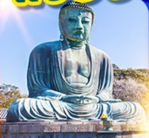
พระใหญ่ คามาคุระ