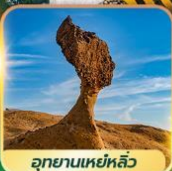
อุทยานเหยหลิว