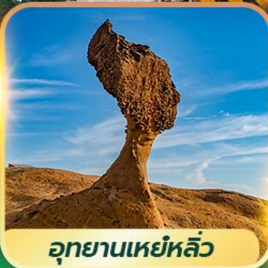
อุทยานเหยหลิว