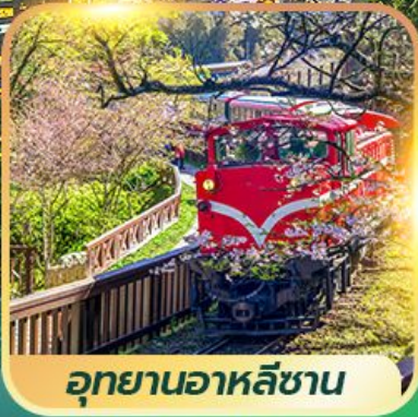
อุทยานอาหลิซาน