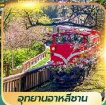
อุทยานอาหลี่ซาน

เที่ยวครบ 4 อุทยาน !! อาหลี่ซาน - ไถ่ฝิงซาน - เหยหลิว - ทาโรโกะ