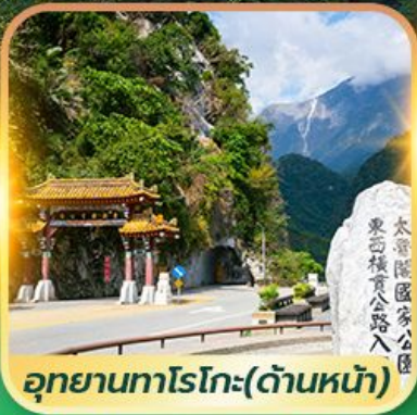
อุทยานทาโรโกะ(ด้านหน้า)