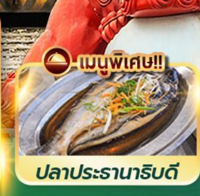
เมนูพิเศษ!! ปลาประรานาธิบดี