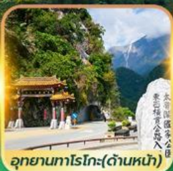
อุทยานทาโรโกะ(ด้านหน้า)