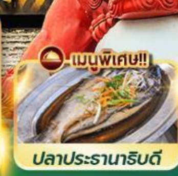
เมนูพิเศษ!! ปลาประรานาธิบดี