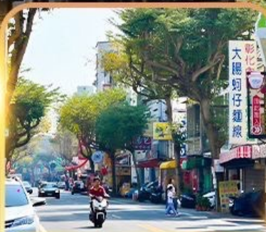
ถนนโบราณอันผิง