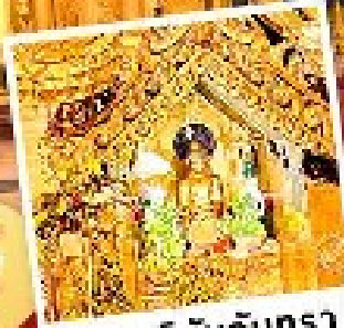
พระสุริยอินจันตรา