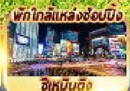
พัก ไทลีสแองซ็อบบิง