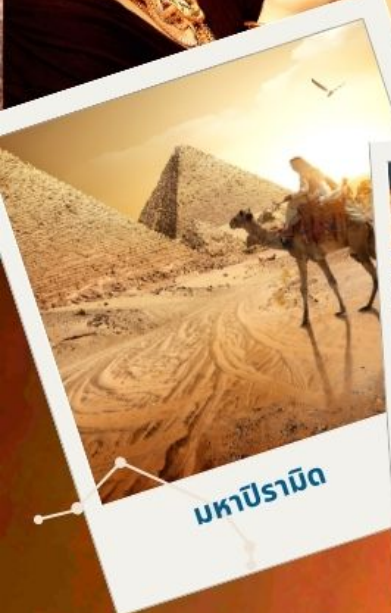
มหาปิรามิด