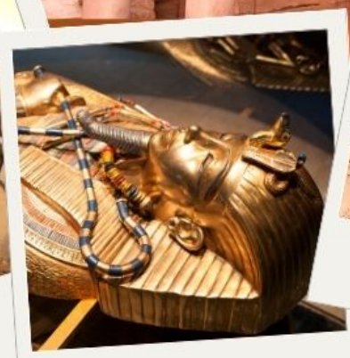
พิพิธภัณฑ์สถานแห่งชาติอียิปต์