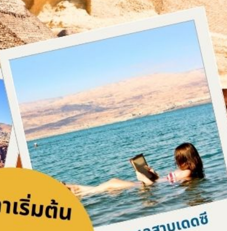
ทะเลสาบเดดซี