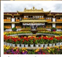
ตำหนักนอร์บูหลินมา

ชมวิวยอดเขานานเจียปาหว่า / จุดชมวิวกะเลปาหลูกลาง / อุทยานเข่าเปิ่นยี่ / ระเบียงกระจก / วัดลามะ พระราชวังโปตาลา / วัดโจคัง / ถนนแปดเหลี่ยม / ทะเลสาบน้ำมูเซว / ตำหนักนอร์บูหลินมา / เมืองโบราณลั่วใต้