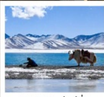
ทะเลสาบน้ำมูเซว