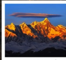
เขานานเจียปาหว่า