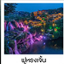
ฟูรงเจิน