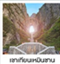
เขากียนหมินซาน