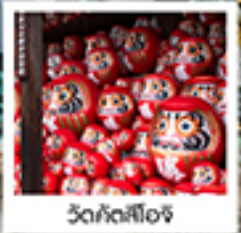
วัดคังสึอิชิ