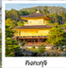
กิงกะกุจิ