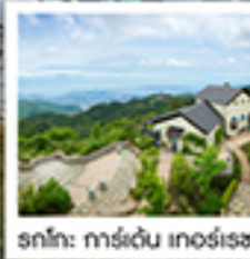
รทโกะ คาร์เด็น เกอร์เรซ