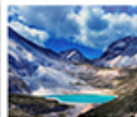
ทะเลสาบน้ำนม