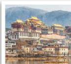
วัดซงจ้านหลิน