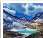
ทะเลสาบน้ำนม