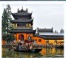
หมู่บ้านโบราณจูเซียงเจียว

สวนสนุกยูนิเวอร์แซลปักกิ่ง / สวนสนุกเซี่ยงไฮ้ดิสนีย์แลนด์ / หมู่บ้านโบราณจูเซียงเจียว ขึ้นหอไข่มุก / ลอดอุโมงค์ทะเลเซอร์ / หาดไวทาม / จิตตวิเวกเทียนอันเหมิน พระราชวังโบราณกู้กง / กำแพงเมืองจีนด่านจี้หยงกวน สนามกีฬาโอลิมปิกปักกิ่ง / ถนนโบราณเฉียนเหมิน