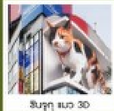
สิงหล นวด 30

คัมภีร์เมนูคุณพิเศษ บุฟเฟ่ต์ฮาลาลไม่อั้น