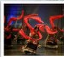
โรว์ทิเบต