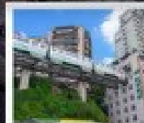
ตม.ฉงชิ่ง

ทัวร์คุณภาพ ไม่ลงร้านฮ้อปปีง • ไม่ขายออฟชั่น