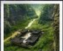
อุทยานฉงชิ่ง