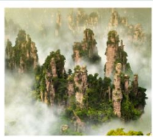
เซาอวตาร