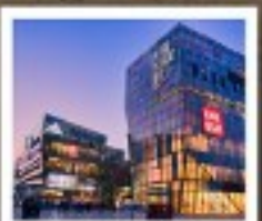
ย่านซานหลี่ตุ่น