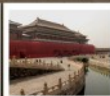
พระราชวังปักกิ่ง