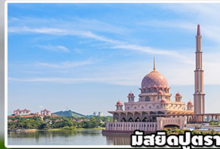
มัสยิดปุตรา