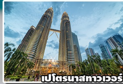
เปโตรนาสทาวเวอร์