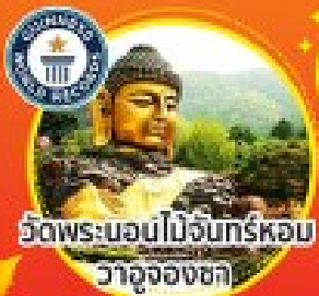
วัดพระบอมนมจันทร์หอม วาจุงองชกา