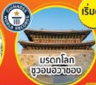
มรดกโลก อุทยานฮวาซอง