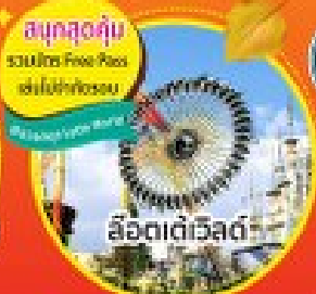
สโตนเทวีลด์