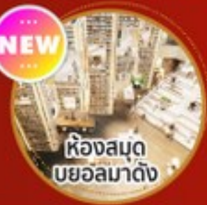
ห้องสมุด บยอลมาดิง