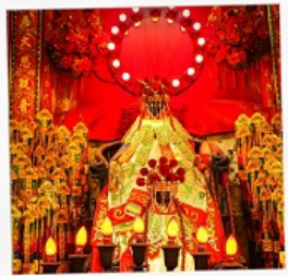
เจ้าแม่กวนอิมสองห้า