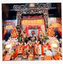
วัดเทพเจ้ากวนอู