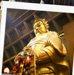
วัดเชกงกมิว