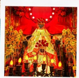
เจ้าแม่กวนอิมสองฮา