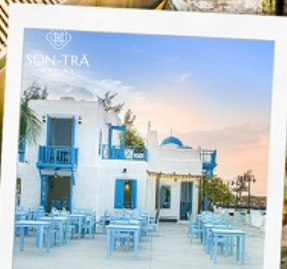
ซานตารีน่าคาเฟ่