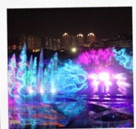
โชว์ม่านน้ำสามมิติ OCT BAY WATER SHOW