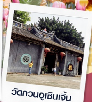
วัดกวนอูเซินเจิ้น