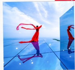
กระเจกกิ่งท้องฟ้า