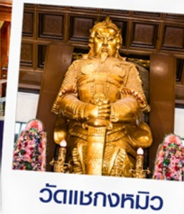
วัดเขากงหมิว