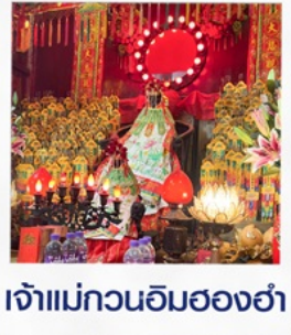
เจ้าแม่กวนอิมสองฮา