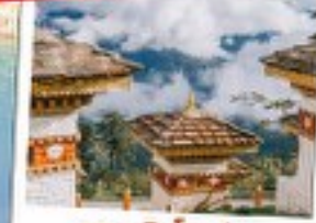
จุดชมวิวดอชูล่า (DOCHULA)