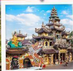
วัดมังกร