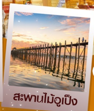
สะพานไม้จูปิง