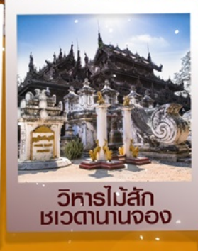
วิหารไม้สัก เขตตานานจอง