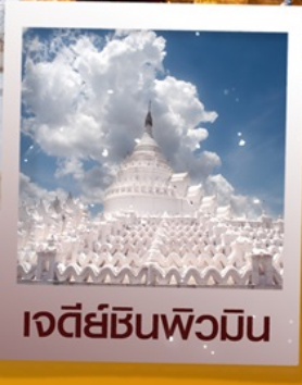
เจดีย์ชินพิวมิน