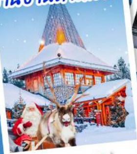
หมู่บ้านซานตาคลอส