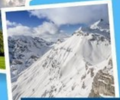
ยอดเขาซิลรอร์น