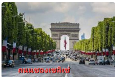
ถนนชองป์เอลิเซ่