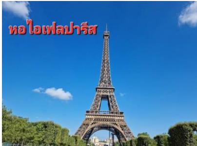
หอไอเฟลปารีส

จากนั้นนำท่าน ถ่ายรูป กับตัวอาคารพิพิธภัณฑ์ลูฟว์ (ด้านนอก) นำท่านชม จตุรัสคองคอร์ด เป็นสัญลักษณ์ของสงครามกลางเมืองและการปฏิวัติการปกครองของฝรั่งเศส เนื่องจากในสมัยปฏิวัติฝรั่งเศสปี ค.ศ. 1789 ลานแห่งนี้ได้ใช้ประหารพระเจ้าหลุยส์ที่ 16 และพระนางมารีอังตัวเนต ด้วยกิโยตี ใกล้กันเป็นสวนตุยเลอรีส์ สวนแบบฝรั่งเศสที่ออกแบบไว้อย่างงดงาม มีเสาหินโอเบลิสก์ขนาดใหญ่ เป็นเสาปลายแหลมสูง 23 เมตร อายุกว่า 3,000ปี จากเมืองลักซอร์ในประเทศอียิปต์ ยังมีรูปปั้นและน้ำพุ