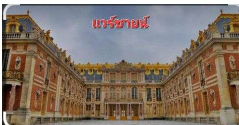
แวร์ซายน์

นำท่าน เข้าชมพระราชวังแวร์ซายส์ (VERSAILLES) (เข้าแบบ VIP ไม่ต้องต่อคิวรอนาน มีไกด์ท้องถิ่น บรรยาย ) สัมผัสความยิ่งใหญ่อลังการของพระราชวังที่ได้รับการยกย่องว่าใหญ่โตมโหฬารและสวยงามที่สุดในโลก ซึ่งได้รับการตกแต่งไว้อย่างหรูหราวิจิตรบรรจง ชมความงดงามของห้องต่างๆ ที่มีเอกลักษณ์เฉพาะตกแต่งประดับประดาด้วยภาพเขียนต่างๆและเฟอร์นิเจอร์ชั้นดี เช่น ห้องอพอลโล, ห้องนโปเลียน, ห้องบรรทมของราชินี, ห้องโถงกระจกท้องพระโรง, ห้องสงคราม และห้องสันติภาพ ฯลฯ ซึ่งรวบรวมเรื่องราวและความเป็นมาในอดีตอันยิ่งใหญ่ของพระราชวังแห่งนี้