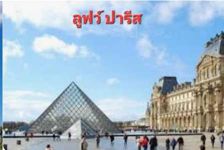
ลูฟว์ปารีส