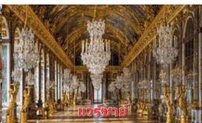
แวร์ซายน์