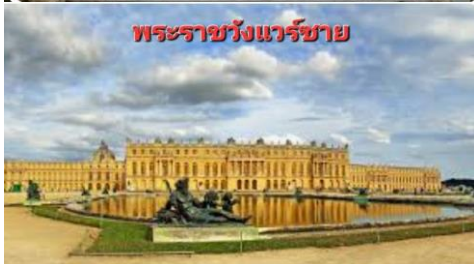
พระราชวังแวร์ซาย