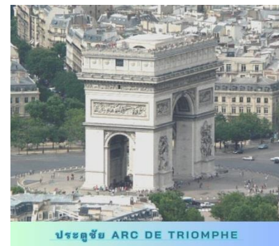
ประตูชัย ARC DE TRIOMPHE