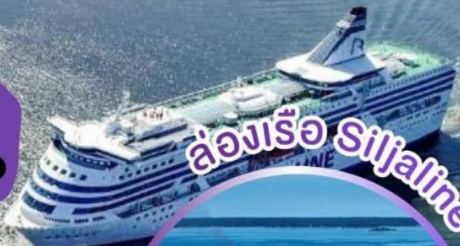
ล่องเรือ Siljaline

ล่องเรือและพักบนเรือสำราญ SILJALINE ล่องเรือและพักบนเรือสำราญ DFDS SEAWAY มีบินภายในไม่ต้องนั่งรถไกล