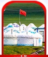
หมู่บ้าน พื้นเมือง