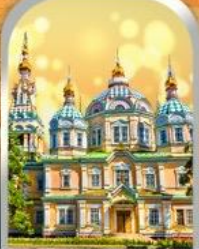
ASCENSION CATHEDRAL ALMATY