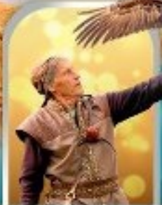
SUNKAR FALCONRY ALMATY