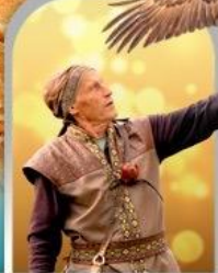
SUNKAR FALCONRY ALMATY