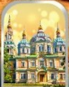
ASCENSION CATHEDRAL ALMATY